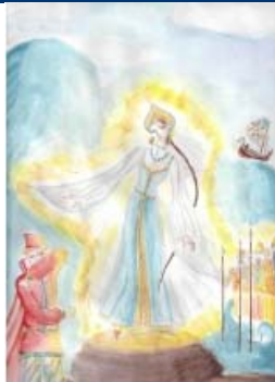
4. Подмузжная Дарья, Россия